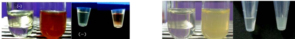
正常検体 溶血検体 正常検体 溶血検体 正常検体 乳ビ検体 正常検体 乳ビ検体 200mg/dL 200mg/dL 乳ビ検体の色見本は 1,000 ホルマジン濁度