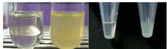
正常検体 乳ビ検体 正常検体 乳ビ検体 乳ビ検体の色見本は 1000 ホルマジン濁度